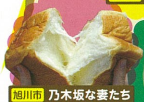
旭川市 乃木坂な妻たち