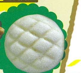
江別市 PICCO BAKERY