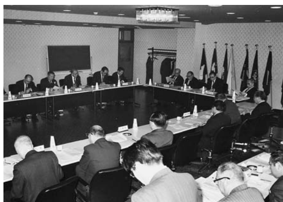
広域圏組合会議（昭和58年）

この頃の代表的事業の一つが海外研修視察事業で、国内外の先進的な施策事例や広域的な取り組みの見聞を広めて、将来の地域づくりの参考とする人材育成を図ることを目的に実施された。当初5回の実施が計画され、その後1回を加えて6回にわたって派遣されたが、当初の高い基金果実も低金利の影響を受けて、平成10年度以降は休止となった。事前