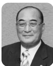
副理事長(赤平市長) 高尾 弘明