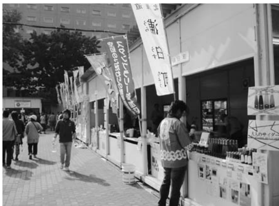
さっぽろオータムフェスト2010