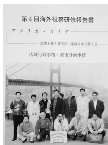
海外視察研修 (平成6年)